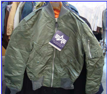
Bomber L2B anni '50 Vintage Made in USA